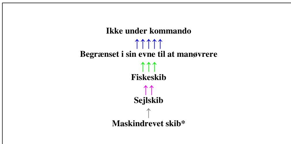
Fig. 1 Hierarkiet til havs.

*Et skib, som er hæmmet af sin dybgang, er som at betragte som alm. maskindrevet skib, og det skal navigere med forsigtighed. Dog skal andre skibe undgå at ”vanskeliggøre sikker passage”.